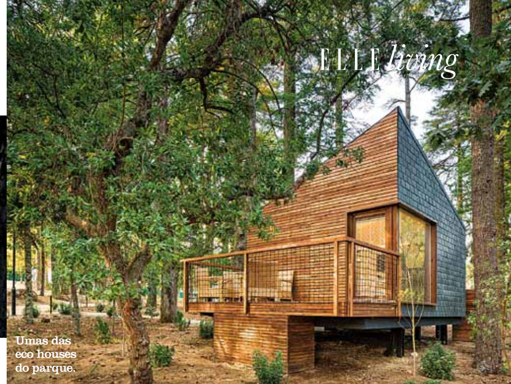
Um das eco houses do parque.