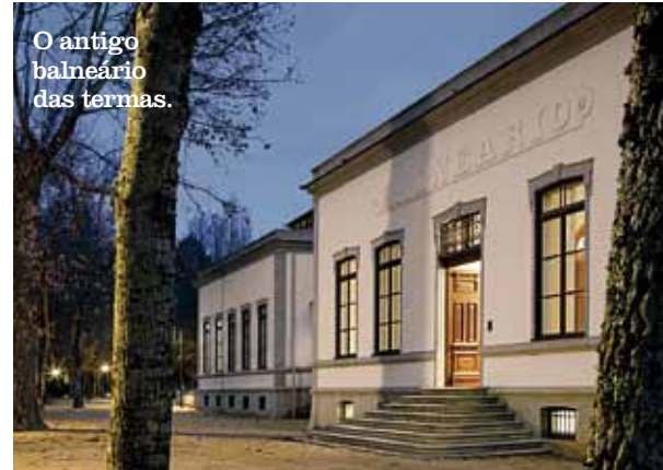
O antigo balneário das termas.

PORTUGAL (CONTINENTE) EUR 3,50 (IVA INCLUIDO)